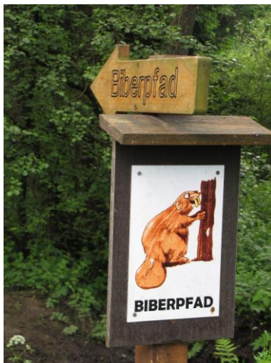
Wegweiser mit Biber Benno

Genießen Sie die Natur, lauschen Sie dem Zwitschern der Vögel, schnuppern Sie den duftenden Wald und erfahren Sie viel Wissenswertes!