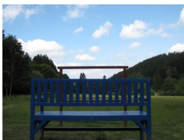
Panoramafenster mit Blick über das Bibertal