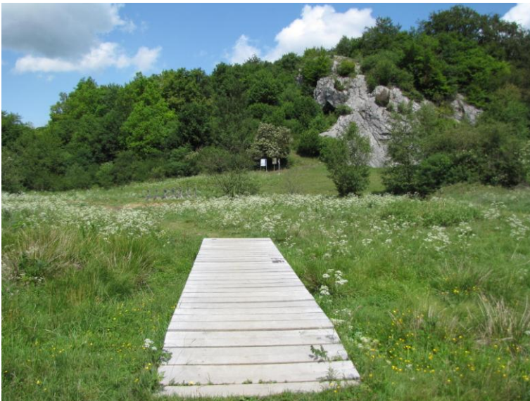
Kulturhöhle „Hohler Stein“

Die Gegend und Umgebung laden zudem zu ausgedehnten Wanderungen ein. (Der „Walderlebnis Biberpfad“ und die Kulturhöhle „Hohler Stein“ liegen beide auf der insgesamt 240 km langen Sauerland Waldroute)